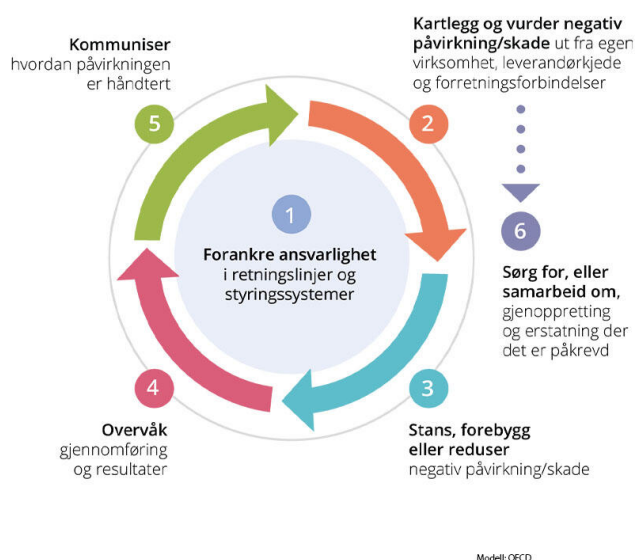
Figur 2: OECDs 6-stegsmodell for aktsomhetsvurderingsprosessen. (Figuren er hentet fra OECDs veileder for aktsomhetsvurderinger for ansvarlig næringsliv, 22.05.2023).

Foreliggende rapport er utarbeidet i samsvar med OECDs aktsomhetsmodell for vurdering av ansvarlig næringsliv (OECD, 2019). Rapporten er bygd på de seks ulike stegene som fremkommer av modellen (Figur 2).