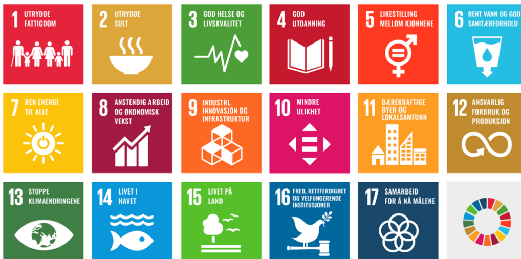
Figur 1: FNs bærekraftsmål (Figuren er hentet er fra unicef.no, 06.06.2023)

Bertheussen IT ønsker å bidra til å ivareta og styrke FNs bærekraftsmål. Vi anerkjenner vårt ansvar med å bidra til en bærekraftig utvikling for næringslivet og sivilsamfunnet. Foreliggende rapport treffer innenfor flere av FNs bærekraftsmål, herunder å utrydde fattigdom, god helse, likestilling mellom kjønnene, rent vann og gode sanitærforhold, anstendig arbeid og økonomisk vekst, mindre ulikheter, fred og rettferdighet, og samarbeid.